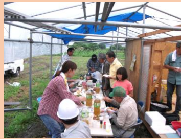
耕作者の皆さんと懇親会

今回の「種まき祭」は、地域の皆様同士の交流イベントとして、また『いざ！に備える』地域づくりについて考えるキッカケになればと思っています。